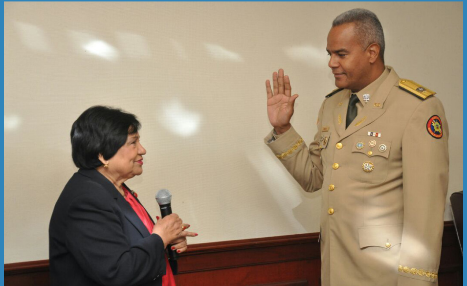
Ministra de Educación Superior, Ciencia y Tecnología (MESCyT) juramenta al Rector del INSUDE, como miembro del Consejo Nacional de Educación Superior, Ciencia y Tecnología (CONESCYT).

Según el reglamento de la calidad de las Instituciones de Educación Superior "Es necesario conocer del cumplimiento por las instituciones de educación superior, de los requerimientos de calidad de los servicios que ofrecen, de los procesos y de los productos de su gestión, por lo cual se prevé la aplicación de la evaluación como un proceso que aporta