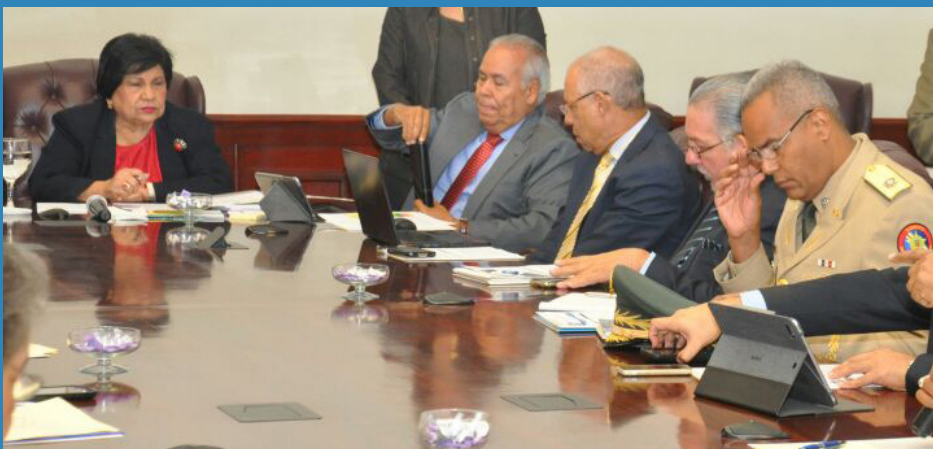
Señores miembros del CONESCYT en sesión.