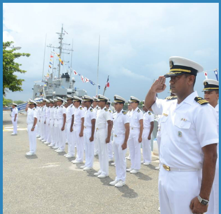
Unidades navales en la clausura del Crucero de Instrucción para Caballeros Guardiamarinas "Verano 2015".

Durante la travesía los Guardiamarinas tuvieron la oportunidad de poner en práctica sus habilidades marineras, lo que contribuye directamente con el proceso de su formación académica en las áreas de navegación astronómica, navegación de estima, navegación electrónica, manejos de equipos electrónicos a bordo de las unidades así como aplicaciones de las leyes marítimas, búsqueda y rescate, interdicción marítima, abordaje, entre otras, en las cuales están siendo formados.