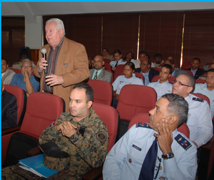
Docentes participando del conversatorio.

Como parte del Plan de Desarrollo Institucional, el Instituto Superior para la Defensa “General Juan Pablo Duarte y Díez” (INSUDE,) ha estado llevando a cabo una serie de acciones que involucren a cada uno de los actores que forman parte de esta Institución de Educación Superior, a fin de garantizar que cada uno de estos sea un ente activo en el cumplimiento de los objetivos trazados, de igual forma, detectando y supliendo las necesidades de los mismo, con la finalidad de garantizar que existan los recursos necesarios y que las condiciones sean las óptimas para llegar al objetivo planteado.