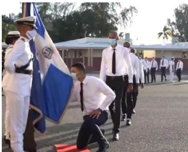
Aspirantes a Guardiamarinas durante el beso a la bandera.