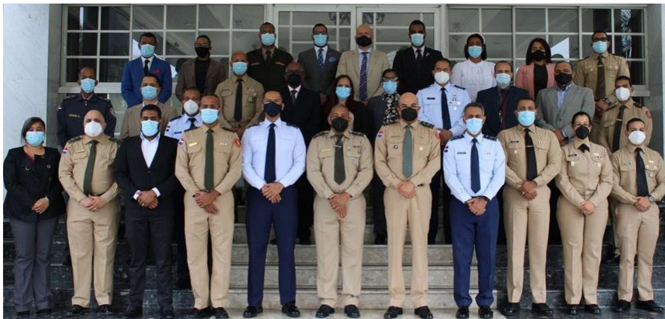
Los discentes de la 14 º promoción de la Especialidad en Geopolítica.

El Ministerio de Defensa a través del Instituto Superior para la Defensa “General Juan Pablo Duarte y Díez” y de la Escuela de Graduados de Altos Estudios Estratégicos, recibe formalmente a los discentes de la 14 º promoción de la Especialidad en Geopolítica.