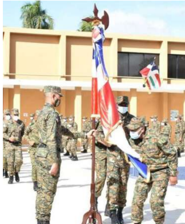
Aspirantes a Cadetes del Ejército de República Dominicana en el Acto de bienvenida.

El 14 de enero del presente año, el Mayor General Julio Ernesto Florián Pérez, ERD., Comandante General del Ejército de la República Dominicana, encabezó el Acto de bienvenida y nuevo ingreso de los Aspirantes a Cadetes del Ejército de República Dominicana a esta Academia Militar “Batalla de las Carreras.” realizado en el patio de armas de la institución.