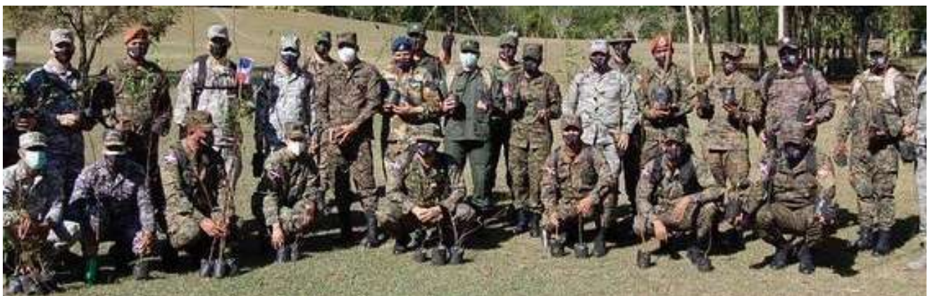
El Mayor General Víctor A. Mercedes Cepeda, ERD., Viceministro de Defensa para Asuntos Militares, durante su exposición de la conferencia a los discentes de la XXXVIII Promoción de la Especialidad en Comando y Estado Mayor Conjunto.

Los discentes realizaron un programa de reforestación para la ayuda de nuestro ecosistema, como también dieron un recorrido en lancha por la Laguna Manatí con la finalidad de ver y contemplar la forma y vida que mantiene dicha laguna.