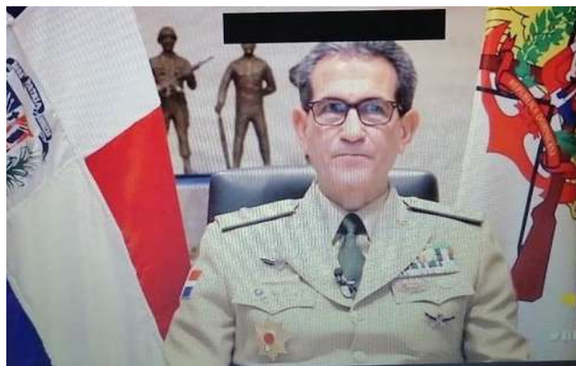
El Ministro de Defensa, Teniente General Carlos Luciano Díaz Morfa, ERD., durante sus palabras de apertura en el curso.

La Organización de Estados Americanos (OEA), en la Asamblea General del año 2004, aprobó la Estrategia Interamericana Integral para Combatir las Amenazas a la Seguridad Cibernética, en la que se instruye a los Estados Miembros a construir, mediante un enfoque integral, capacidades en seguridad cibernética pero, lamentablemente, las Fuerzas Armadas quedaron un tanto retrasadas frente a otras instituciones.