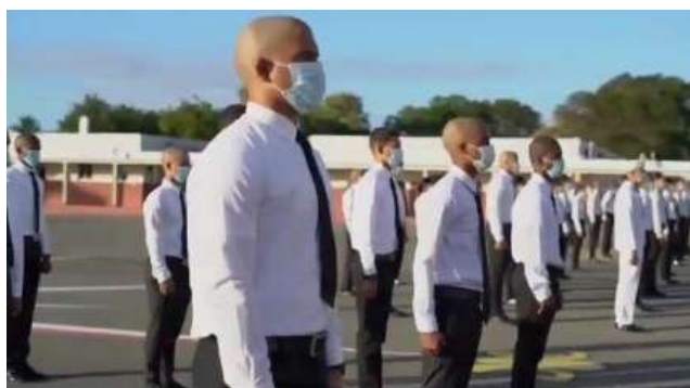
Aspirantes a Guardiamarinas en la explanada de la Academia Naval durante el ingreso.