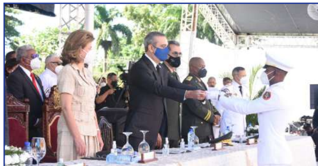
El Excelentísimo Sr. Presidente de la República Luis Rodolfo Abinader Corona, Autoridad Suprema de las Fuerzas Armadas y la Policía Nacional, en la entrega de sable.