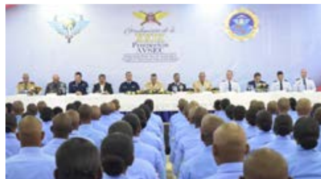
Mesa principal de la vigésima novena promoción del curso de "Instrucción Básica para el personal de Seguridad de Aeropuertos" (AVSEC), encabezada por el Ministro de Defensa, Teniente General, ERD, Rubén Darío Paulino Sem.