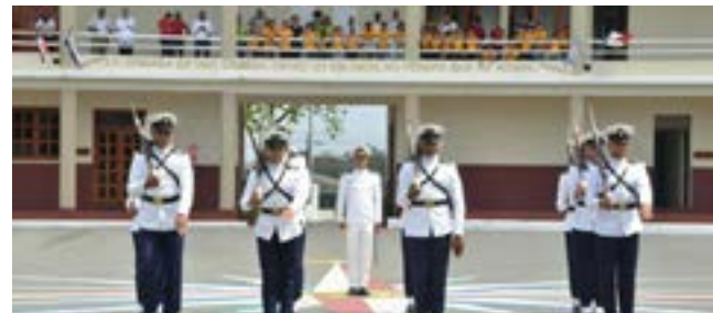
Guardiamarinas de 3er. año, en la exhibición del Manual de Armas en Silencio, a los niños del Campamento de Verano del Club arroyo Hondo.