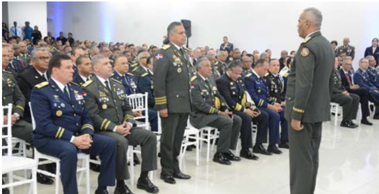
El Rector del INSUDE, General de Brigada Valerio Antonio García Reyes, ERD, pide el permiso de lugar al Señor Ministro de Defensa Rubén Darío Paulino Sem, ERD, para aperturar el Simposio INSUDE 2019, Ciberseguridad, Ciberdefensa "Las amenazas en el Ciberespacio".

Ciberseguridad, Ciberdefensa "Las Amenazas en el Ciberespacio" y la Feria Tecnológica DEFENSATECH. Durante la misma y en conmemoración al Simposio INSUDE 2019, el Rector del INSUDE, General de Brigada Valerio Antonio García Reyes, ERD, hizo entrega al Ministro de Defensa, Teniente General Rubén Darío Paulino Sem, ERD, de las primeras impresiones 3D realizadas por el INSUDE, consistente un tanque de guerra, un ancla y un avión.