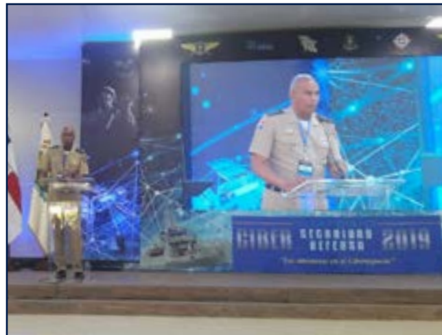
General de Brigada Valerio Antonio García Reyes, ERD, Rector del Instituto Superior para la Defensa "General Juan Pablo Duarte y Diez" (INSUDE) durante su discurso en el acto de clausura del Simposio INSUDE 2019, "Ciberseguridad, Ciberdefensa "Las amenazas en el Ciberespacio".

El Ministerio de Defensa (MIDE), a través del Instituto Superior para la Defensa "General Juan Pablo Duarte y Diez" (INSUDE), realizó con éxito su quinta entrega del Simposio INSUDE 2019, sobre Ciberseguridad y Ciberdefensa: "Las amenazas en el Ciberespacio" y la Feria Tecnológica DEFENSATECH.