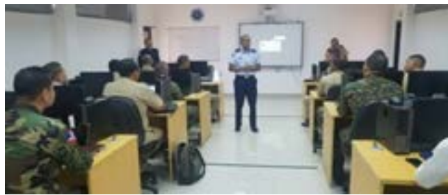
El Director de la Escuela de Graduados de Doctrina Conjunta (EGDC) del INSUDE, General de Brigada Paracaidista Miguel Paulino Espinal, FARD., con los participantes del Curso en el aula, durante las palabras de bienvenida.

El 04 de Junio del año en curso, en el aula del Centro de Operaciones Tácticas, el Director de la Escuela de Graduados de Doctrina Conjunta (EGDC) del INSUDE, General de Brigada Paracaidista Miguel Paulino Espinal, FARD., dio las palabras de bienvenida a los cursantes del curso de "Operaciones de Sostenimiento", de manera semi-presencial y virtual, el cual está dirigido a Oficiales Superiores de las Fuerzas Armadas y la Policía Nacional y tiene como propósito adiestrar a oficiales superiores en el manejo de los planes de sostenimiento o concepto de apoyo de los Planes Operacionales Conjuntos vigentes de las Fuerzas Armadas Dominicanas, con el objetivo de elevar su desempeño como miembros de un Estado Mayor, cada vez que se desempeñe en ese campo.