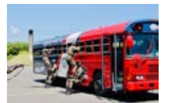
Los Cadetes de la Academia Aérea "General de Brigada Piloto Frank Andrés Félix Miranda, FARD, en el Ejercicio de despeje de Vehículos.