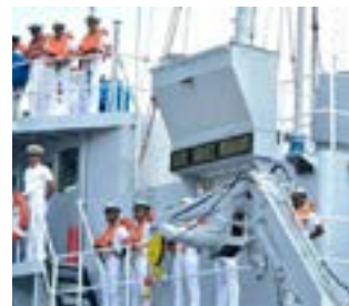
Los Cadetes a bordo del buque Almirante Burgos, crucero de instrucción para las damas y caballeros guardiamarinas, denominado "Maestro del Mar 2019".