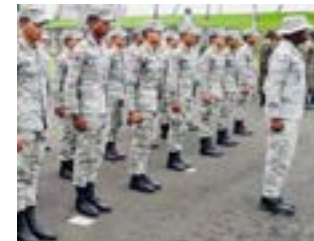
Los Cadetes de 4to. Año, de la Academia de la FARD, del INSUDE, en la fortaleza Fort Desaix, en For de France Martinica.

Los Ejercicios que realizaron los cadetes, en la Isla de Martinica, Colonia Francesa fueron: Desplazamiento y combate acuático, supervivencia, identificar puesto seguro para pernocta, identificar amenazas en los manglares. Durante la Fase Náutica, los cadetes aprendieron y realizaron infiltraciones por mar y tierra, al igual que la transportación de un compañero herido en combate por las zonas de montañas, agua, manglares, pantanos y el fortalecimiento en una pista náutica. La fase de supervivencia y movilidad táctica se realizaron en las montañas del norte de Martinica.