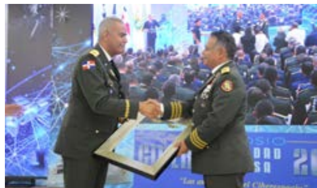
El General de Brigada Valerio Antonio García Reyes, ERD, hace entrega al Ministro de Defensa Rubén Darío Paulino Sem, ERD, de una placa de reconocimiento.