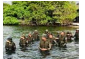
Los Cadetes de 4to. Año, de la Academia de la FARD, del INSUDE, en la Isla de Martinica, en el ejercicio de desplazamiento y combate acuático.